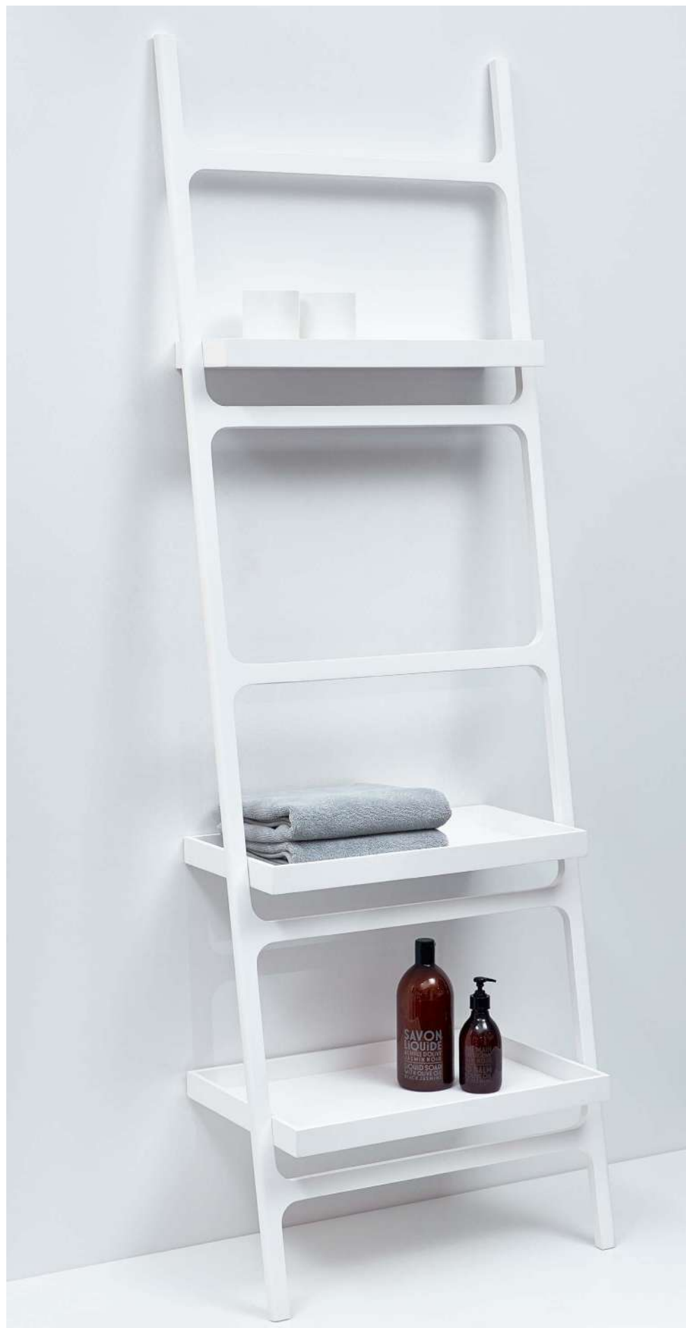
STONE HTLA Handtuchleiter / Towel ladder H 180 . B/W 60 . T/D 34cm mit 3 Ablagen / with 3 shelves wandmontiert / wall mounted Mineralwerkstoff weiß / Mineral-cast white