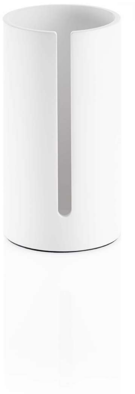
STONE RRB Reserverollenbehälter / Spare paper bin H 30 . Ø 15,5cm Mineralwerkstoff weiß / Mineral-cast white