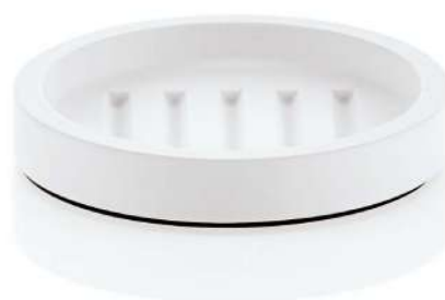
STONE SA Standseifenschale / Soap dish free standing ohne Einsatz / without insert H 2 . Ø 11,5cm Mineralwerkstoff weiß / Mineral-cast white