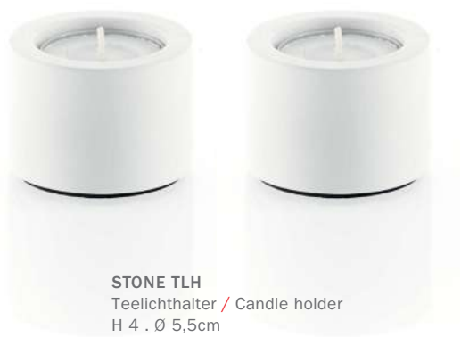
STONE TLH Teelichthalter / Candle holder H 4 . Ø 5,5cm Mineralwerkstoff weiß / Mineral-cast white