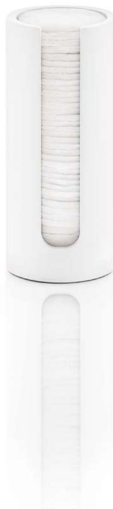
STONE WPB Wattepadbehälter / Recipient for cotton pads H 17 . Ø 7cm Mineralwerkstoff weiß / Mineral-cast white