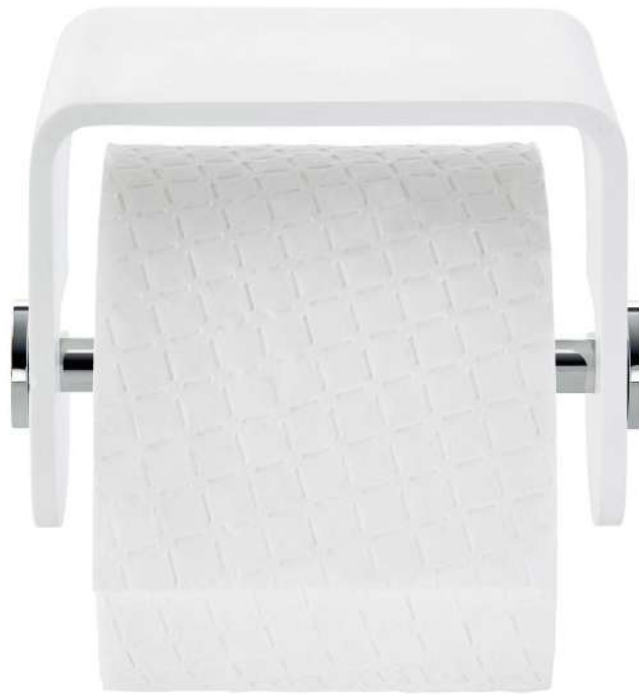
STONE TPH4 Toilettenpapierhalter / Toilet paper holder H 10 . B/W 13 . T/D 10cm Mineralwerkstoff weiß / Mineral-cast white mit Chrom / with Chrome mit Edelstahl matt / with Stainless steel matt