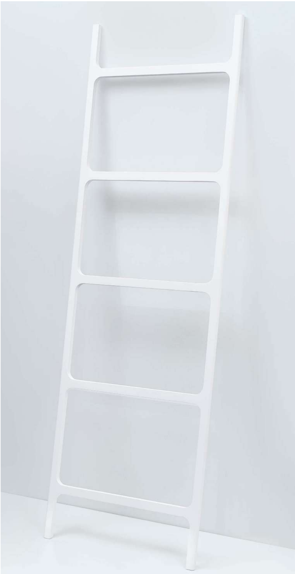
STONE HTL Handtuchleiter / Towel ladder H 180 . B/W 60 . T/D 2cm Mineralwerkstoff weiß / Mineral-cast white