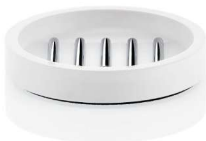
STONE STS Standseifenschale / Soap dish free standing mit Einsatz / with insert H 2 . Ø 11,5cm Mineralwerkstoff weiß / Mineral-cast white mit Chrom / with Chrome mit Edelstahl matt / with Stainless steel matt