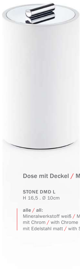
Dose mit Deckel / Multi-purpose box with lid