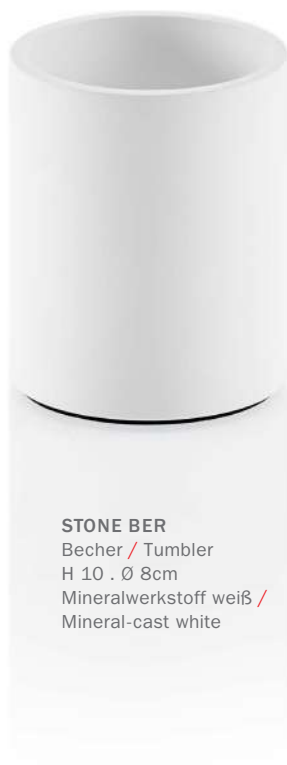
STONE BER Becher / Tumbler H 10 . Ø 8cm Mineralwerkstoff weiß / Mineral-cast white