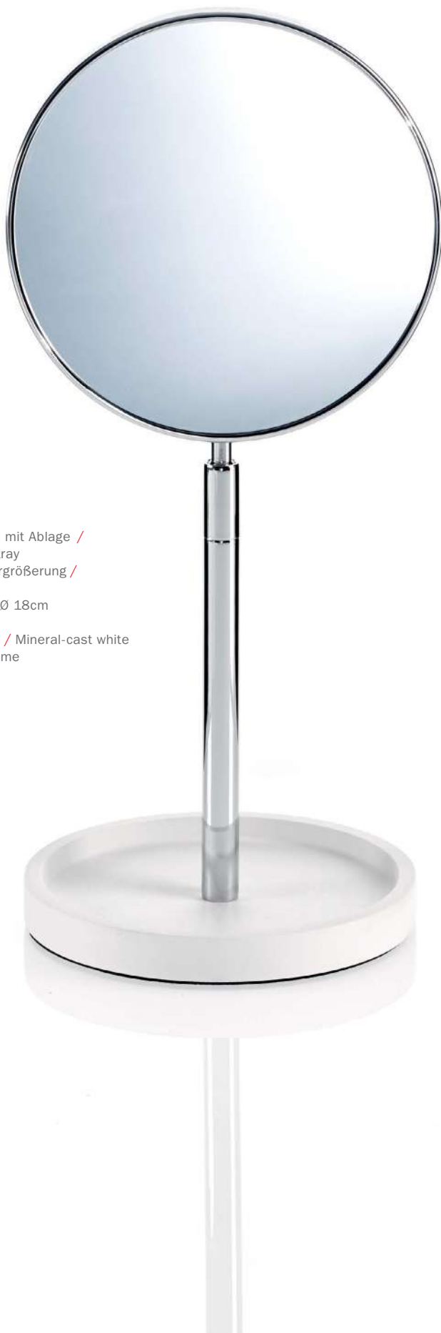
STONE KSA Standkosmetikspiegel mit Ablage / Cosmetic mirror with tray 4-fache + 1-fache Vergrößerung / 4x +1x magnification gesamt / total H 40 . Ø 18cm Fuß / Base Ø 16,5cm Mineralwerkstoff weiß / Mineral-cast white mit Chrom / with Chrome